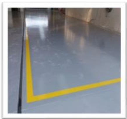
Oficina de ônibus em santa luzia 600m 2