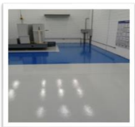
Cmp componentes plásticos 1.200 m 2

E-mail: ctepoxyvendas@gmail.com empreiteirabrasiladm@gmail.com