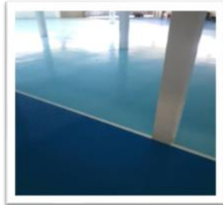
playcar São Luis do maranhão 4.500 m 2