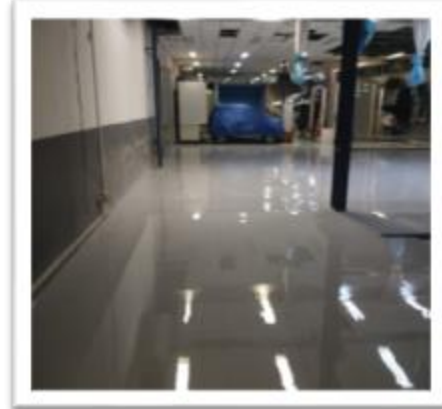
Fabrica da fiat 800 m 2